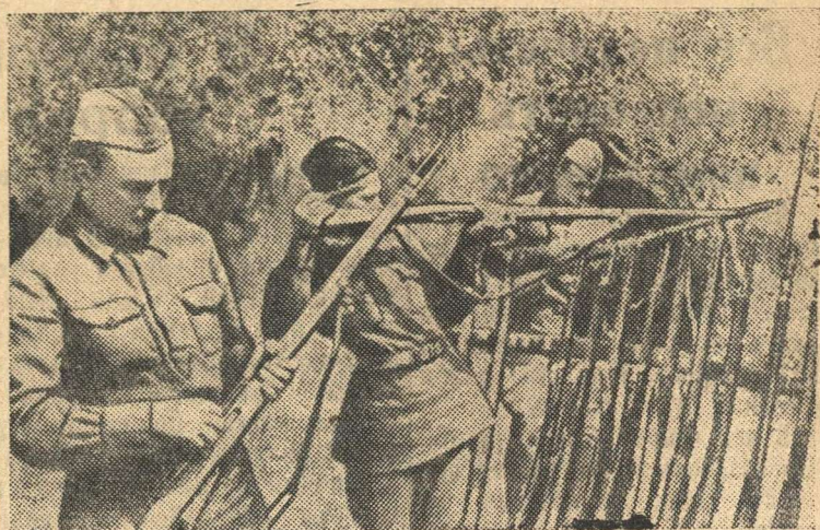
Ополченцы получили боевое оружие.