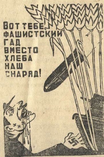
Плакат работы художника М. Китизарьяна, ТАСС.

А. ДОЙНИКОВ, председатель Рождественского сельсовета.