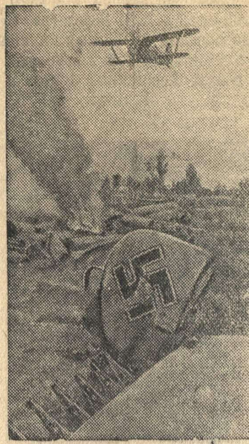
Славный советский сокол парит над сбитым им фашистским стервятником.

было назначено на пятницу 22 августа. В этой связи арестована группа молодых офицеров иранской армии, а также несколько иностранцев, которые, как утверждают, были привлечены к заговору нацистскими агентами.