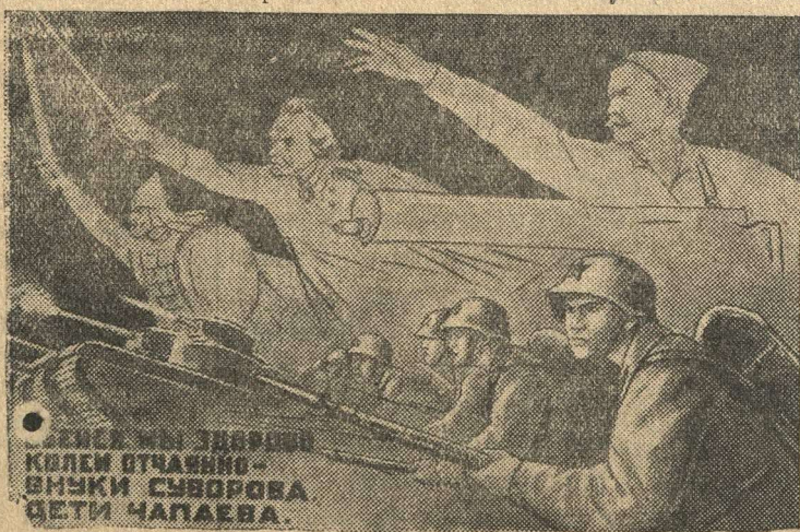
Рисунок художников Кукрыныцкы.

С возгласами „Вперед, за родину!“ капитан повел свое подразделение, нанес противнику штыковой удар. Перед лавиной красноармейцев, неудержимо прорвавшихся сквозь завесу огня, немцы дрогнули и побежали.