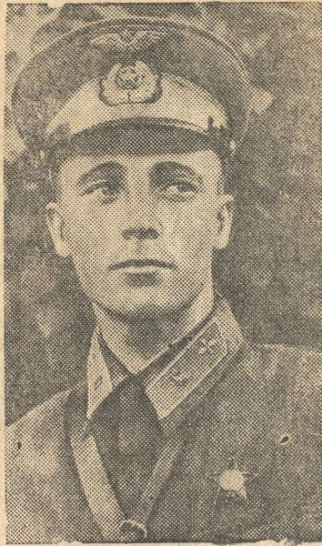
Герой Советского Союза летчик-истребитель младший лейтенант В.В. Талалихин. Он героически атаковал и протаранил фашистский бомбардировщик „Хейнкель-111“, пытавшийся прорваться к Москве.