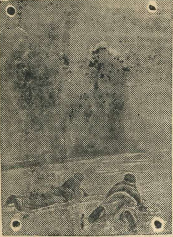
Саперы взрывают немецкие ДЗОТы под местечком М.