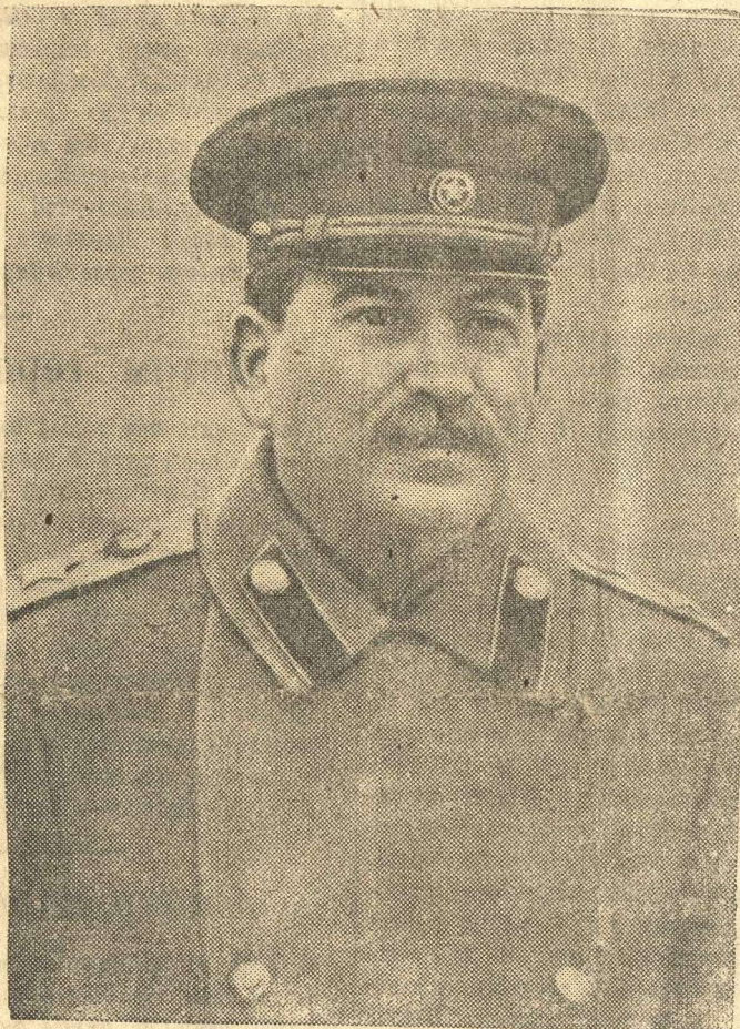
Верховный Главнокомандующий Маршал Советского Союза Иосиф Виссарионович СТАЛИН

В январе нынешнего года Красная Армия обрушила на врага небывалый по силе удар на всем фронте от Балтики до Карпат. Она взломала на протяжении 1200 километров мощную оборону немцев, которую они создавали в течение ряда лет. В ходе наступления Красная Армия быстрыми и умелыми действиями отбросила врага далеко на запад. Советские войска с упорными боями продвинулись от границ Восточной Пруссии до нижнего течения Вислы — на 270 километров, с плацдарма на Висле южнее Варшавы до нижнего течения реки Одер — на 570 километров, с Сандомирского плацдарма в глубь немецкой Силезии — на 480 километров.