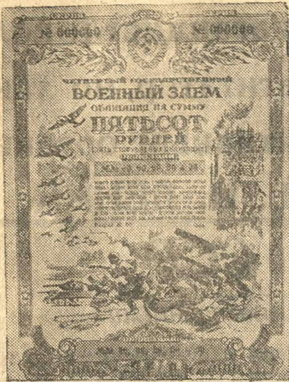
Четвертый Государственный Военный Заем. Образец облигации достоинством пятьсот рублей.

Трудящиеся СССР! Единодушной подпиской на Четвертый Государственный Военный Заем продемонстрируем силу и мощь советского государства, его непоколебимую волю окончательно разгромить врага!