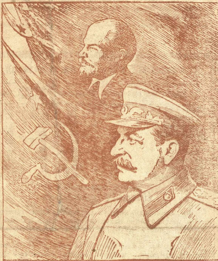
—ПОД ЗНАМЕНЕМ ЛЕНИНА, ПОД ВОДИТЕЛЬСТВОМ СТАЛИНА — ВПЕРЕД К НОВЫМ ПОБЕДАМ!

Слава героической Красной Армии, отстоявшей