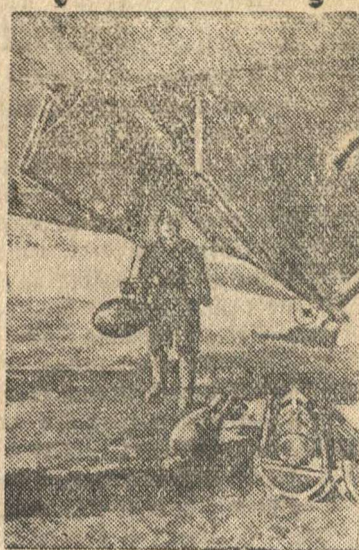
Перед боевым вылетом

офицеров раненые вытаскивались на двор и расстреливались. Может ли после этого честный человек оставаться в стане гитлеровских насильников? Не может!»