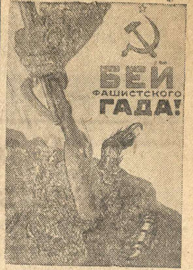
Рисунок художника Кокорекина

(Репродукция с плаката, выпущенного издательством «Искусство»).