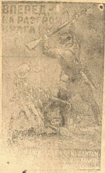
Плакат работы художника Д. Шмаринова, выпущенный издательством «Искусство».

В нашей роте есть значительная группа солдат, желающих добровольно сдаться в плен. Я могу назвать больше десятка фамилий, но прошу их не оглашать в прессе, так как это может им повредить. Они ждут удобного случая, чтобы перейти на сторону русских».