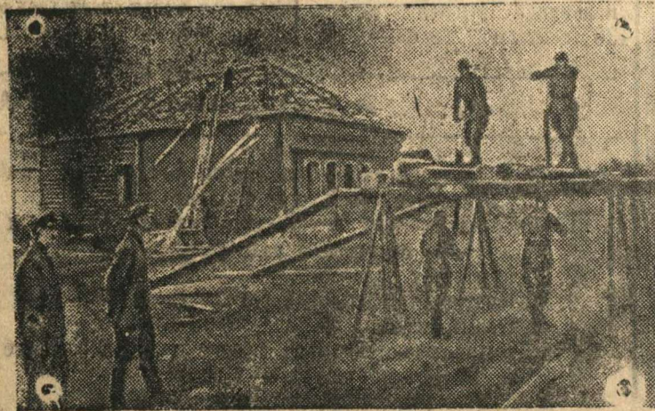
Бойцы Н-ской части строят новую школу в колхозе дер. Игумново (Можайский район), разоренной гитлеровцами.