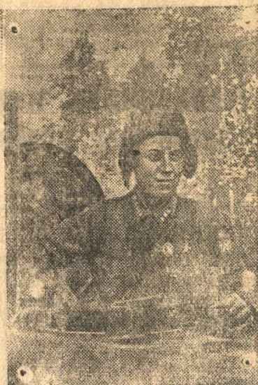
Герой Советского Союза