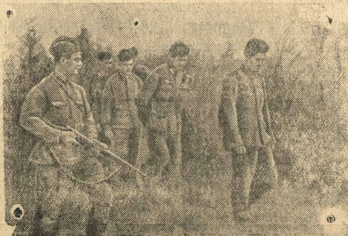
Группа гитлеровцев, захваченных в плен, направляется в тыл.

(Район Зубцова)