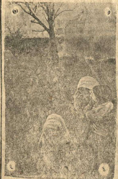
В селе Серболево Ленинградской обл., сожженом гитлеровскими захватчиками.