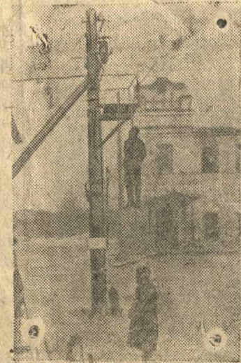
На снимке: Визелица на улице населенного пункта.

(Снимок найден у убитого на Ленинградском фронте немецкого солдата).