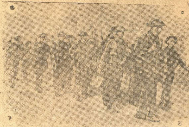
На снимке: Солдаты английского военно-воздушного полка продвигаются в Мазон бланш (Алжир) для занятия аэродрома.