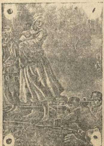
На снимке: «Варварство немецких оккупантов» — картина работы художника П. Тбидзе.

Выставка «Великая Отечественная война» в Государственной Третьяковской галерее.