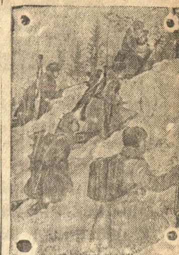
На снимке: Минометный расчет под командованием комсомольца сержанта С. Белжаняна выдвигается на новую огневую позицию.