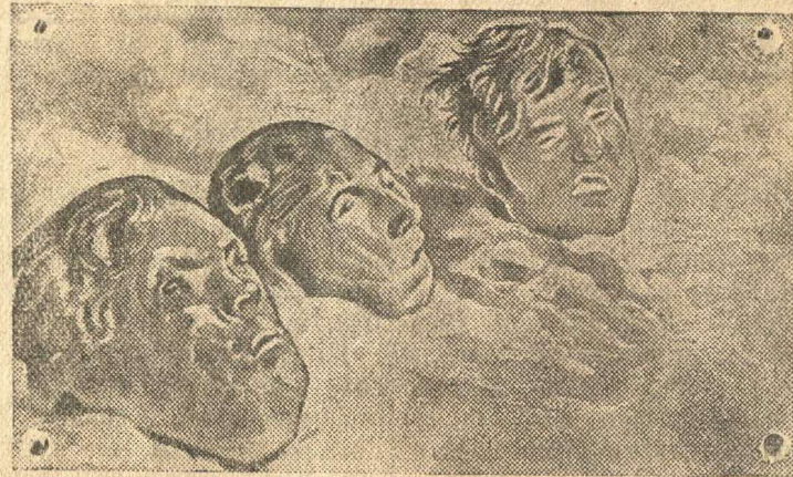
Н а с н и м к е: Три отрубленных головы с проломами в черепках — следами зверских истязаний пленных.