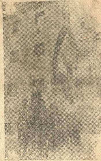
На снимке: Взорванный немцами при отступлении корпус тюрьмы вместе с находившимися в камерах арестованными советскими гражданами.

Накануне отступления из города гитлеровцы расстреляли в тюрьме свыше 700 советских граждан, из них около 300 женщин.