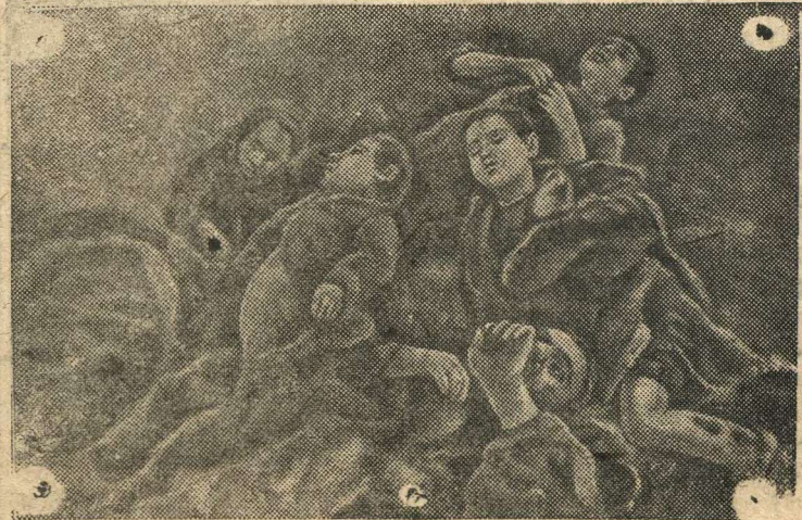
На снимке: Трупы расстрелянных.

В деревне 1-я Алексеевская, Колпнянского района, Орловской области, гитлеровцы замучили и расстреляли среди многих семью местных жителей.