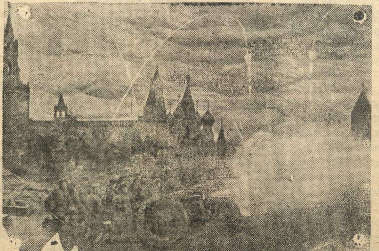
На снимках: (слева) На Красной площади у репродукторов (справа) Салют Москвы.