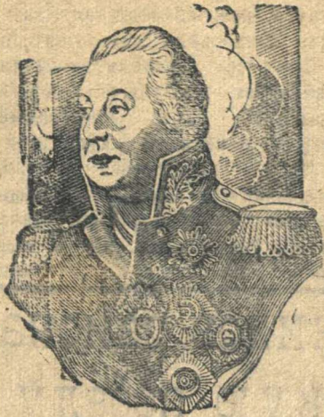
Великий русский полководец М. И. КУТУЗОВ. Рисунок К. Теодоровича.

После смерти Суворова (1800 г.) Кутузов остался главным представителем национального русского военного искусства. Но Александр 1-й, не любивший Кутузова, уволил его в отставку. Это было время, когда Наполеон начинал завоевание Европы. В 1805 году