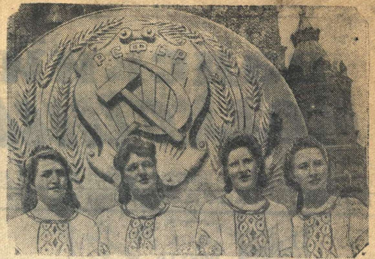
Всесоюзный парад физкультурников на Красной площади в Москве 12 августа 1945 г.