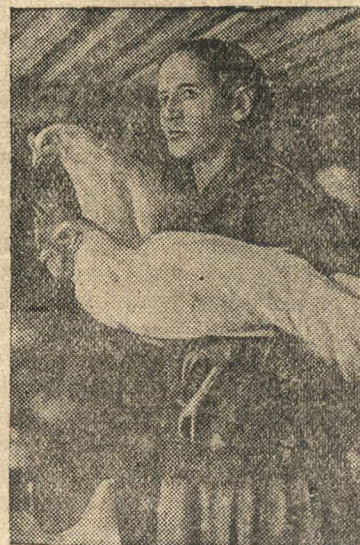
В колхозе имени 8 марта (Ленинский район, Московская область) выстроены зимний птичник.

Только применяя весь комплекс указанных выше мероприятий, можно вырастить здоровый и крепкий молодняк.