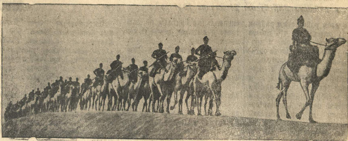
Тренировочные учения египетских войск в условиях пустыни.