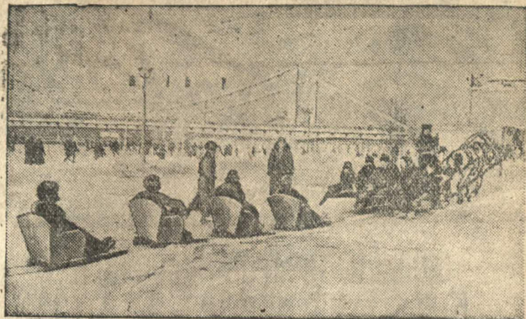
В Центральном парке культуры и отдыха имени М. Горького (Москва). НА СНИМКЕ: Катание детей на санях.

Социализм строится трудом миллионов. И основная задача воспитания—привить уважение ко всякому полезному труду. А между тем стоит только послушать беседы на пионерских сборах, чтобы убедиться в том, как мало у нас об этом заботятся. Ребятам много говорят о героях, но главное внимание обращают