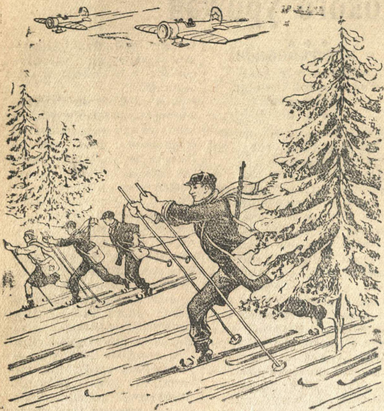
Рисунок К. Теодоровича.

Посвящается спортсменам-лыжникам. Чуть гранет клич: «На бой!» Мы все готовы к бою в час любой. (Из марша физкультурников).