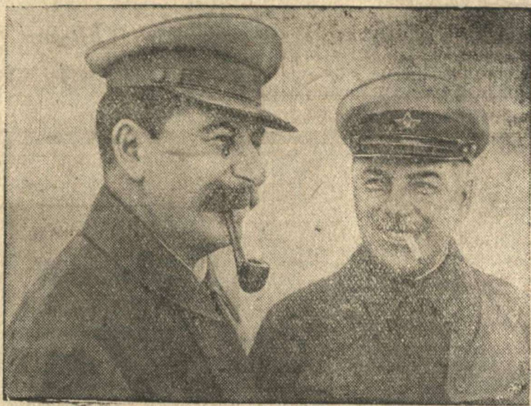
И. В. Сталин и К. Е. Ворошилов (1935 г.).

Глубочайшая партийность пронизывает всю многогранную деятельность товарища Ворошилова и после победы Великой Октябрьской социали-