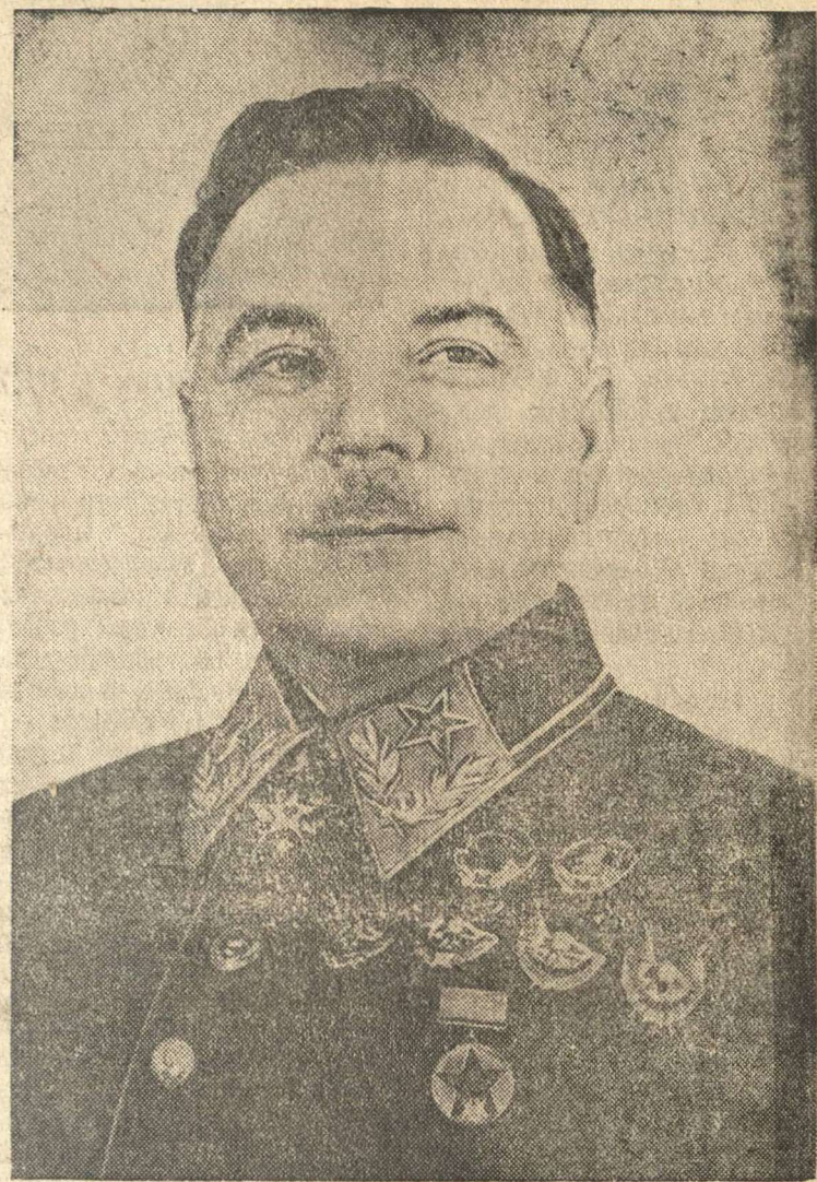
Заместитель Председателя СНК СССР Маршал Советского Союза К. Е. Ворошилов.

Сейчас ни за колхозом, ни за колхозниками нет никакой задолженности.