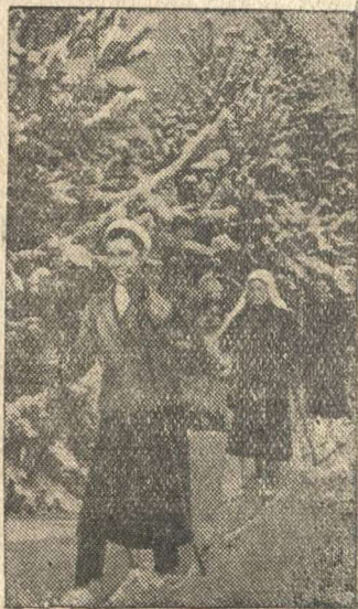
На лыжной прогулке