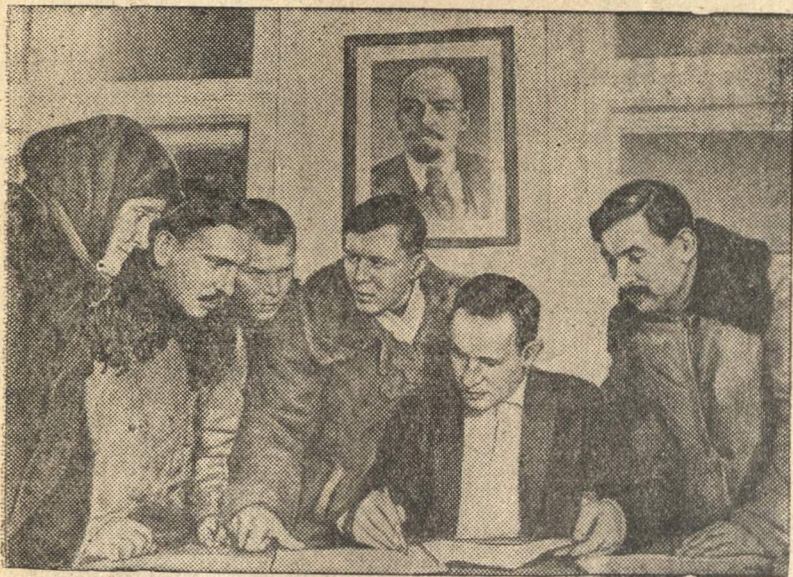
В Советской Литве

Бывшие батраки помещика, ныне получившие землю, беседуют с секретарем сельсовета села Лапей (Каунасский уезд) тов. Рейнерт об организации машинно-тракторного пункта.