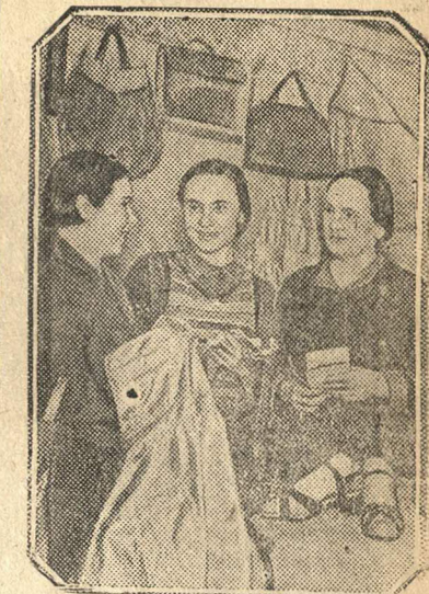
Цех ширпотреба завода «Каучук» (Москва) выполнил программу 1940 г. на 174,9 процента, изготовив товаров широкого потребления на 4.498.000 руб.