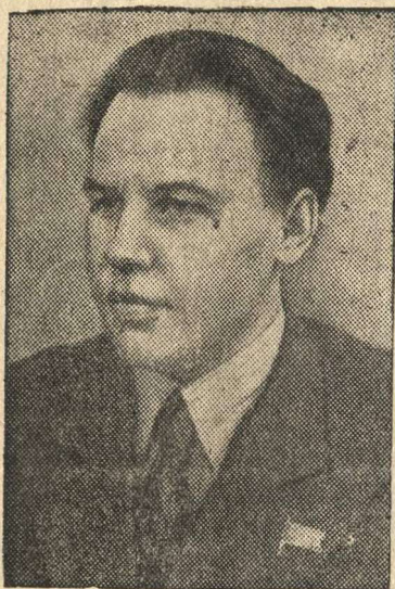
Председатель Госплана СССР и Заместитель Председателя Совета Народных Комиссаров Союза ССР Н. А. Вознесенский.

Тем не менее, задание третьей пятилетки по темпам роста промышленной продукции немного невыполнено. Вместо 14 проц. по пятилетнему плану, фактические среднегодовые темпы роста продукции за истекшие три года составили около 13 проц. Это невыполнение задания по темпам роста производства связано прежде всего с отставанием черной металлургии в начале третьей пятилетки от установленного плана.