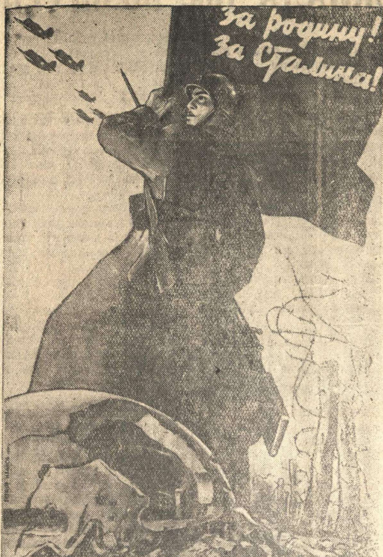
СЛАВА ГЕРОИЧЕСКОЙ КРАСНОЙ АРМИИ!

Рисунок художника В. Иванова. (Репродукция с плаката изд. «Искусство»).