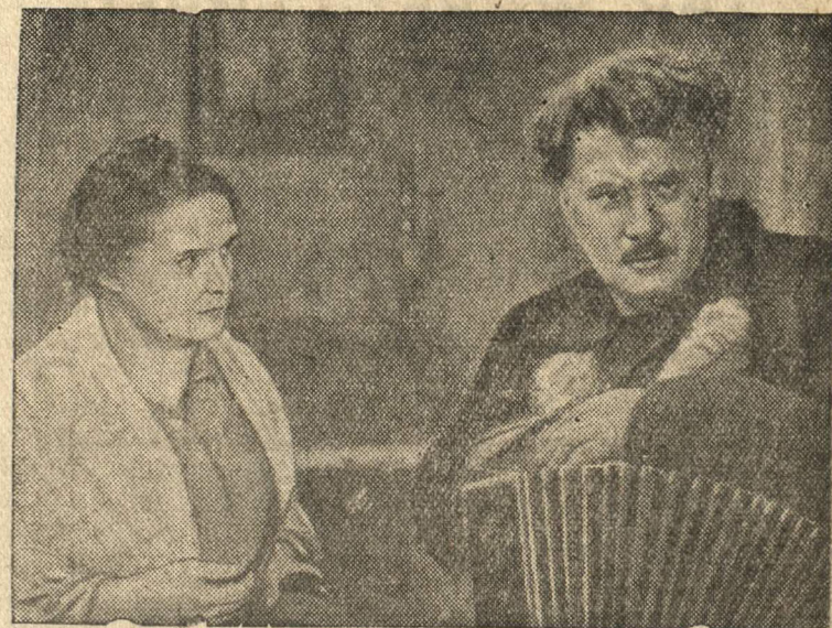
Киностудия «Ленфильм» производит одновременно съемку 2-х новых фильмов: «Поход Ворошилова» и «Оборона Царицына». Часть съемок проводится в московской студии «Союздетфильм».