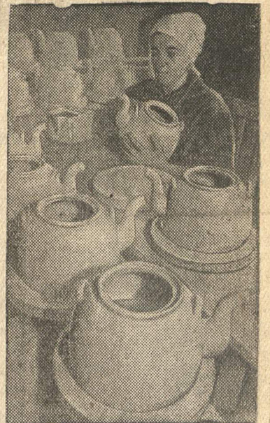
В течение 1941 года Дулевский завод даст стране около 300 тысяч чайников.

Причины плохого выполнения заключаются в том, что заготовки леса пущены на самотек. Среди колхозников, работающих в лесу, слабая трудовая дисциплина. Возчики выезжают в лес в 9—10 часов утра и возвращаются в 2—3 часа дня. Поэтому нормы по вывозке они не выполняют. Лесорубы из колхоза имени Крупской за 12 рабочих дней заготовили 12,2 кубометра, а из колхоза имени Кирова в первой половине февраля сов-