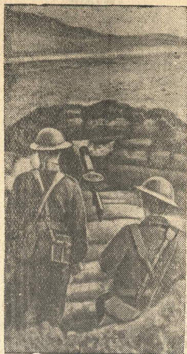
Пулеметное гнездо на одной из дорог в Англии.