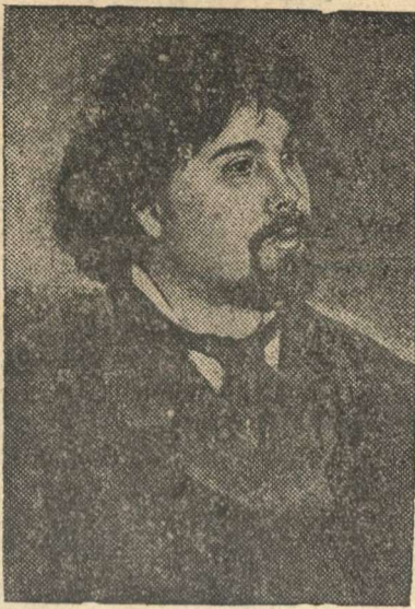
В. И. Суриков (с портрета художника И. Е. Репина, 1887 г.).

19 марта исполнилось 25 лет со дня смерти знаменитого русского художника В. И. Сурикова.