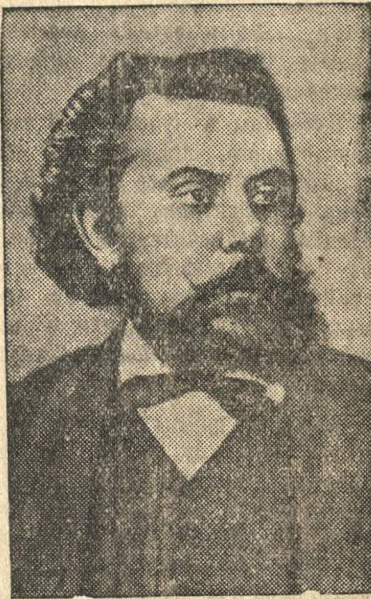
М. П. Мусоргский.

Сегодня 60 лет со дня смерти гениального русского композитора М. П. Мусоргского.