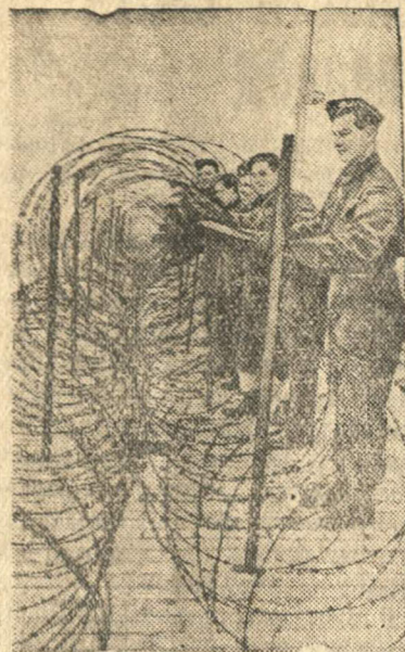
Проволочные заграждения на южном побережье Англии.

Юля Комлева, Соня Онучина, учащиеся Ново-Шоринской НСШ.