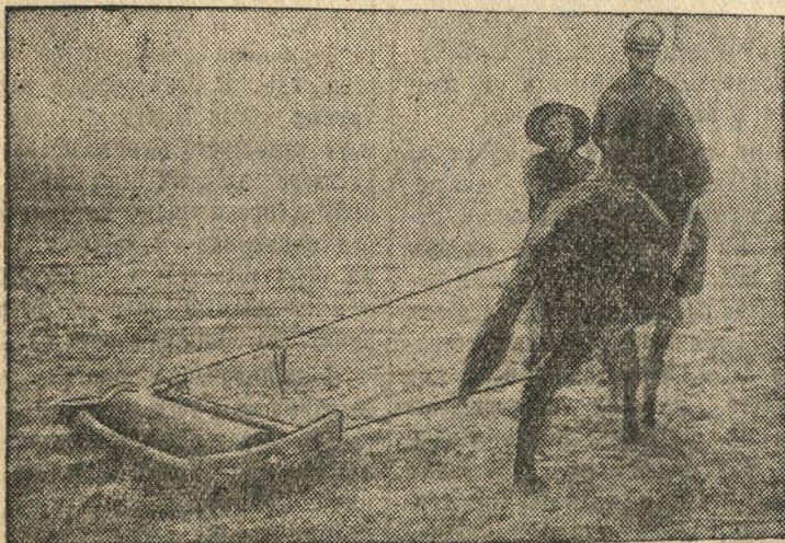
Манчжурский крестьянин на весенних полевых работах.

Адрес редакции: Шахунья, Горьковской обл., Советская 18. Телефоны: Отв. редактор—7, зам. редактора и секретарь—07, литсотрудники—32, бухгалтерия—97