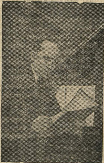
Заслуженный деятель искусств РСФСР и композитор Исаак Осипович Дунаевский. Ему совместно с группой киноработников за кинокартины «Цирк» и «Волга-Волга» присуждена Сталинская премия первой степени.

Прием продолжался несколько часов. Товарищ Сталин, руководители партии и правительства тепло прощаются с присутствующими. И снова раздаются восторженная овация в честь товарища Сталина и его соратников. (ТАСС).