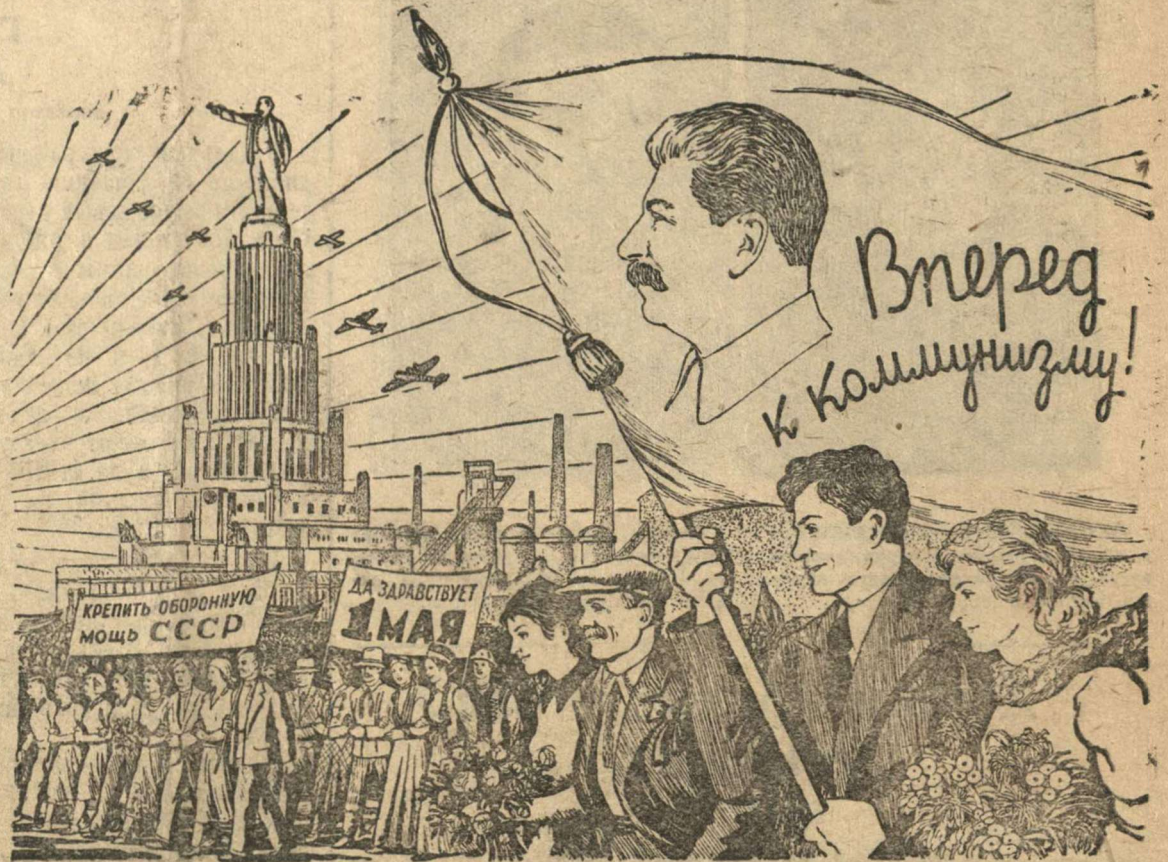
Рисунок Б. Уханова.

Наш социалистический труд, наша борьба за коммунизм показывают рабочему классу всего мира, по какому пути надо идти, чтобы добиться свободы и осуществить те лозунги, которые уже полвека в день 1 мая из края в край земного шара объединяют и сплачивают революционных борцов.