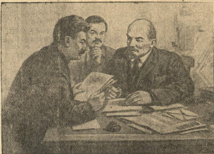
В. И. Ленин, И. В. Сталин и В. М. Молотов в редакции газеты «Правда» — 1917 г. Репродукция из альбома издательства «Искусство» — «Ленин и Сталин» Рисиник художника П. Васильева

День большевистской печати должен послужить делу улучшения работы наших газет, делу укрепления партийного руководства, делу привлечения в газету свежих творческих сил из числа передовых людей района. Повседневно повышать боеспособность нашей печати — долг каждого партийного и непартийного большевика!