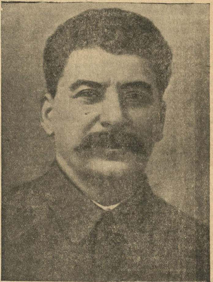
Иосиф Виссарионович СТАЛИН — Председатель Совета Народных Комиссаров СССР.