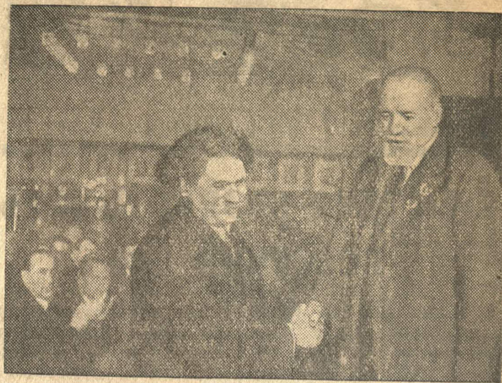
Председатель Комитета по Сталинским премиям в области литературы и искусства В. И. Немирович-Данченко поздравляет писателя С. Н. Сергеева-Ценского.

21 и 22 апреля в Москве состоялось вручение дипломов и денежных премий лауреатам Сталинской премии—деятелям науки, изобретательства, искусства и литературы.