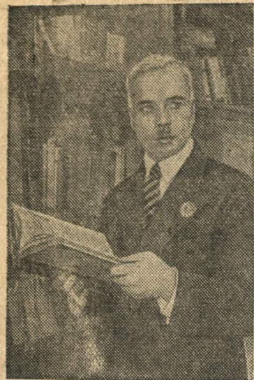
Таджикский поэт и драматург дважды орденосец А. Лахути в своем кабинете

За эти дни через ларек леспродторга было продано луку 6 центнеров. Еще предполагается продать 150 килограммов.