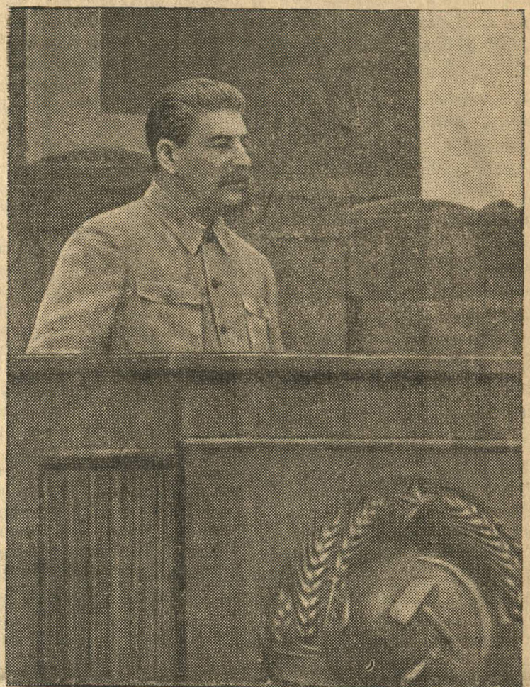
Выступление товарища И. В. Сталина на торжественном собрании, посвященном выпуску командиров, окончивших военные академии, состоявшемся в Большом Кремлевском дворце 5-го мая 1941 года.