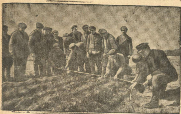
Здесь только что прошел советский трактор с пятилемешным плугом. Трудовые крестьяне впервые видят борозду такой ширины — почти 2 метра.