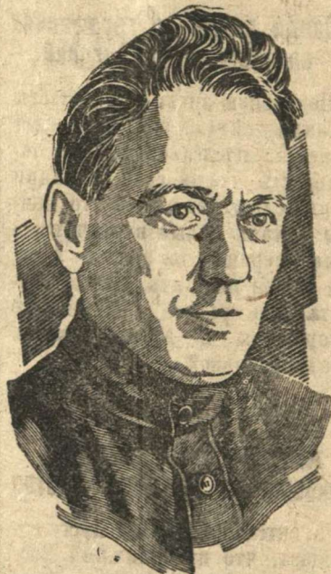
М. А. ШОЛОХОВ.