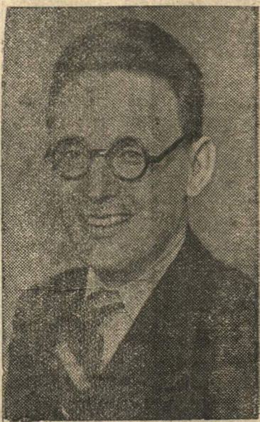
Абсолютный чемпион СССР по шахматам гроссмейстер М. М. Ботвинник.

Школы нашего района имеют все возможности для того, чтобы значительно лучше закончить учебный год, не допустить второгодничества. Для этого у нас есть все условия, залог этому — постоянная любовь и забота народа, партии, правительства и великого Сталина, которые окружают советскую школу огромным вниманием и заботой.