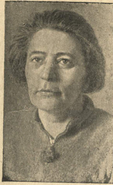
Анна Паукер — одна из активных деятелей рабочего движения в Румынии, долгое время находившаяся в заключении. В результате переговоров между правительствами СССР и Румынии тов. Паукер освобождена из тюрьмы. Она прибыла в СССР и находится в Москве.