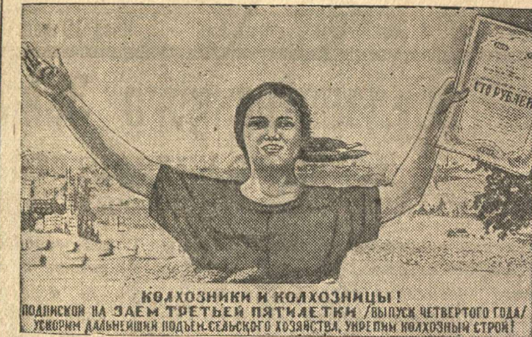
КОЛХОЗНИКИ И КОЛХОЗНИЦЫ! ПОДПИСКОЙ НА ЗАЕМ ТРЕТЬЕЙ ПЯТИЛЕТКИ (ВЫПУСК ЧЕТВЕРТОГО ГОДА) УСКОРИМ ДАЛЬНЕЙШИЙ ПОДЪЕМ СЕЛЬСКОГО ХОЗЯЙСТВА, УВЕРИМ КОЛХОЗНЫЙ СТРОИ!

— Верно. Наш коллектив всегда был передовым. Нам