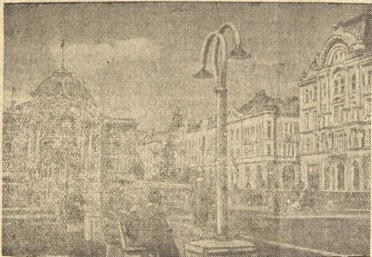
Театральная площадь в г. Черновцах. Слева — Украинский драматический театр, справа — Дворец юных пионеров.