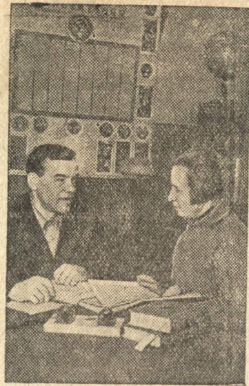
В Талдомском городском парткабинете (Московская область).

Партийные, советские, комсомольские и профсоюзные организации обязаны помнить и не забывать, что радио играет огромную роль в выполнении задач, поставленных XVIII партийным съездом, что оно — могучее средство воспитания трудящихся масс в духе коммунизма.