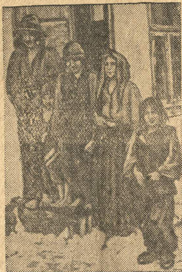
Доведенная до крайней нищеты румынская семья.

Румынские бояре довели румынский народ до полной нищеты и разорения. Население терпит голод, оно не имеет средств, чтобы купить одежду и обувь.