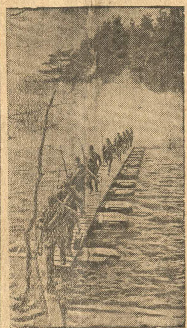
Форсирование водной преграды.