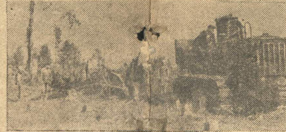
Сверху, слева направо: раскорчевка лугов в колхозе «Земледелец»;