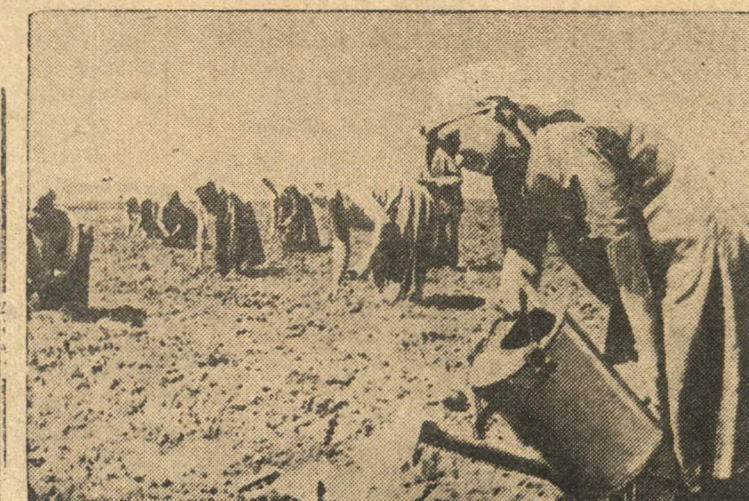
Колхозники сельхозартеля «Земледелец» тщательно ухаживают за овощами на общественном огороде. На переднем плане Розжина Е. Я. поливает капусту.